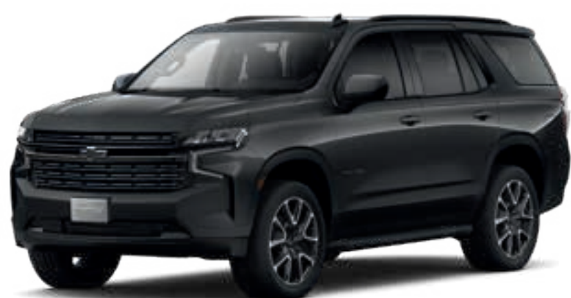
GRIS ASFALTO METÁLICO